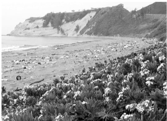
図3. 輪島市三ツ子浜のスナビキソウ群落