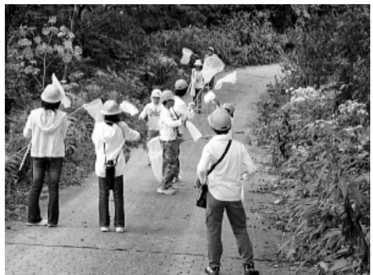
図4. 宝達山のマーキング会