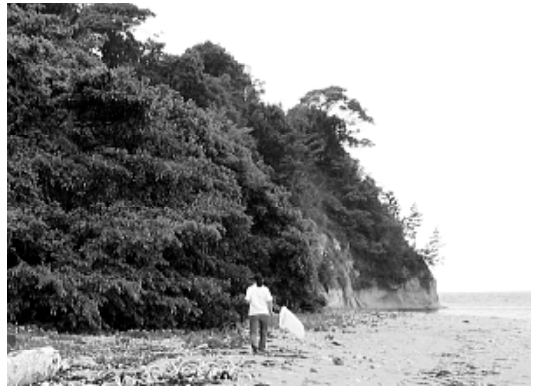
図2. 珠洲市寺家のマーキングポイント