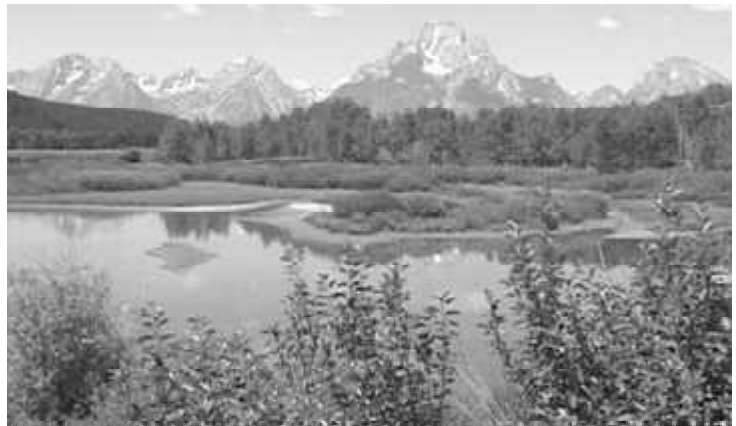
図2：グランドテトン国立公園では、テトン山を中心とした山並みを様々な方向から眺められる。見る時刻や方向で雰囲気は全く異なるところが魅力である。川辺の湿地にはムース（牛のようなシカの仲間）などの動物が見られる。

ジャクソン Jackson は、グランドテトン国立公園の南の玄関口にあたり、観光地としてにぎわっている。今日は早出して、まず近くのテトン峠 Teton Pass, 429ft (=2, 529m) に行った。ここは、情報をもらっていたところである。もう一種のウスバシロチョウとクモマツマキチョウが目標である。峠を西側に少し下ったと