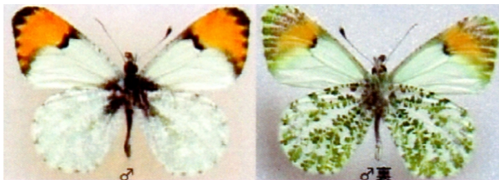
図4：ロッキークモマツマキチョウ Anthocharis stella は、高標高地の沢筋などに局地的に分布する。雄は地色が白で表面前翅先端のオレンジの部分は黒い縁取りがはっきりしている。裏面の模様や色彩は日本のクモマツマキチョウとは異なる。雌は地色が黄色でオレンジの前翅先端まで持つ美しいものなのだが、残念ながら出会えなかった。

さらに登ると、峠近くに花の多いきれいな草原があったので、車を止めて採集にかかる。まず、1頭クロディウスウスバがとれた。やはり、峠の西と東ではかなり環境が違うようだ。エピプソーダベニヒカゲが何頭か採れたが、どうも傷んでいるものが多い。青いシジミは、またメリッサヒメシジミかと思っていたら、何とアメリカカパイロシジミ Glaucopsyche lygdamus oro であった。この蝶は、東部亜種 ssp. lygdamus を6月にメイン州で採ったが、本来春の蝶である。そして、ちょっと小さい感じのベニヒカゲを採ってみると、これが狙いのテアノベニヒカゲであった。日本のベニヒカゲに慣れた私にとっては、おもちゃのような幾何模様の随分変わったベニヒカゲである。林の斜面に入ってみると、小さなシロチョウが降りてきた。とらえてみると、嬉しいロッキークモマツマキチョウであった。こんなところで会えるとは予想外であったので、なおさら嬉しい。もっと、追加しようと探したが、結局♂2頭しかいなかった。小さな林間の日溜まりに蝶が集まっていて、ここで高山