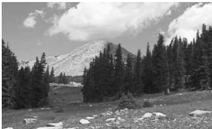
図1：スノーリーレンジ (3,254m) は広々とした場所で、頂上付近には残雪が見られる。周辺の高原は大変気持ちの良いところで、高山植物の宝庫である。蝶が多いポイントにはクリクサスタカネヒカゲやロッキーウスバシロチョウなど多種類の蝶が見られた。足場もよく蚊などもない採集には天国の様な場所であった。

ララミーの町は、乾燥した半砂漠の中にあるのんびりした宿場町のようなところである。朝からお湯が出ないと妻が文句を言っている。フロントに尋ねてみると、理由はよくわからないがガスの供給が突然止まってしまったという。レストランでも電気で暖めるコーヒーと紅茶以外は何も作れないという。客が皆文句を言っているが、どうなる訳でもない。我々は、朝のみで移動してしまったので実害は少なかったが、米国ではこの手のいい加減な状態がしばしば起こる。文句を言って改善すればよいが、どうにもならない場合は忘れ