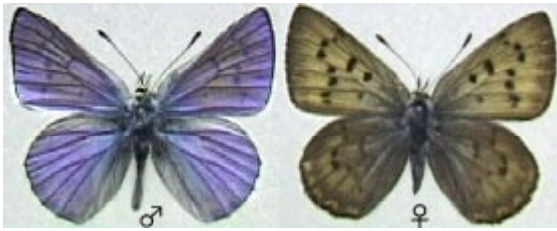
図5: アオベニシジミ Lycaena heteronea heteronea は、その名のごとく雄の表面は青く輝くブルーで、ベニシジミとは理解しにくい。しかし、雌の表面は褐色で、ベニシジミの印象がある。ロッキー山脈では、高原の開けた草原に多い。

ベニシジミであるから、豊かな草原の存在を示している。この中に、マリポーザベニシジミ Lycaena mariposa が混ざっていたのだが、採集時には気付かないお粗末だった。他には、ペリドネモンキチョウ Colias pelidne が林道脇に飛んでおり、ヘロイデスベニシジミやヒョウモン類もいた。黄色いモンキチョウ類は、皆本当によく似ていて同定が難しい。知らないでいると、みんな同じミヤマモンキチョウである。ただ、生息している場所と飛び方が違うようである。ペリドネモンキチョウは、林の中の湿地帯に住んでいることが多いようである。裏面に黒い鱗粉が出るのでややわかりやすい。雌は、なぜかほとんどが白色型である。セセリではソノラアカセセリ Polites sonora utahensis という変わったものがいた。別の開けた牧場横の草原には、ヘロイデスベニシジミやヒョウモン類が多かったが、歩き回っているうちにブルーの早く飛び回るシジミを発見。やや苦労して捕らえてみると、これがBlue copper、つまりアオベニシジミ Lycaena heteronea heteronea であった。採りたい蝶の1つだったので嬉しかった。この後数頭追加できた。雌は茶色でこれはベニシジミとすぐに気づくが、雄は知識がないと正体を間違える。花によく止まるので、これを捕まえればよいが、飛んでいるとネットするのは難しい蝶である。ロッキーイチモンジもいたが、もう傷んでいてあまり採る気にならなかった。それにしても、この日も暑かった。ほとんど真夏の蝶であり、ヒョウモンモドキがいそうな感じはしなかった。