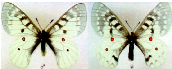
図3: クロディウスウスバシロチョウ Parnassius clodius は、主に湿った林縁などに分布する。習性は日本のウスバシロチョウと同様である。北米特産種。

ころから横道にそれて入ってみた。すぐに、小さな開けた谷間に出た。この辺は、今までの乾燥した環境とは全く異なり、林の中で湿った感じの茎の高い草が茂っている。赤や青の高山植物の花が