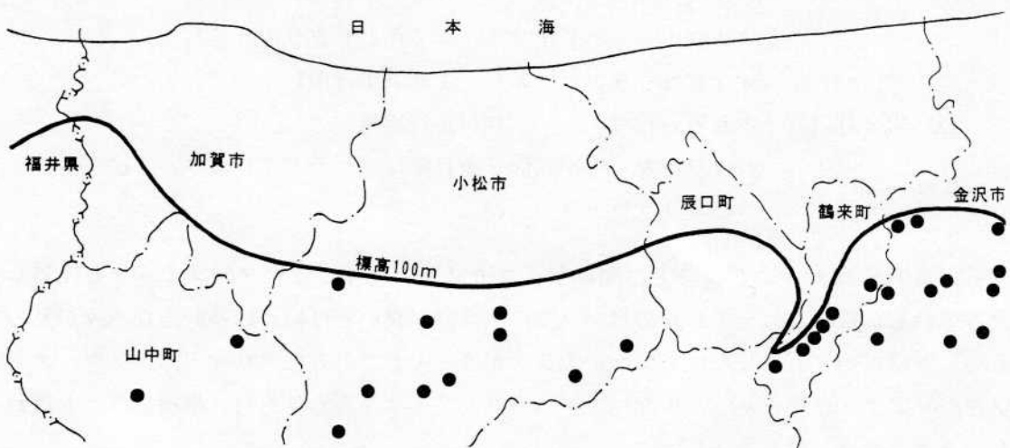
加賀低山帯のウスバシロチョウ分布図

最近、小松昆虫会が発足し、各地での盛んな調査活動が聞こえて来る。新発見や新知見となかなか華々しい。それに比べ分布調査は地味かもしれないが、誰か、熱中してくれる人はいないだろうか。