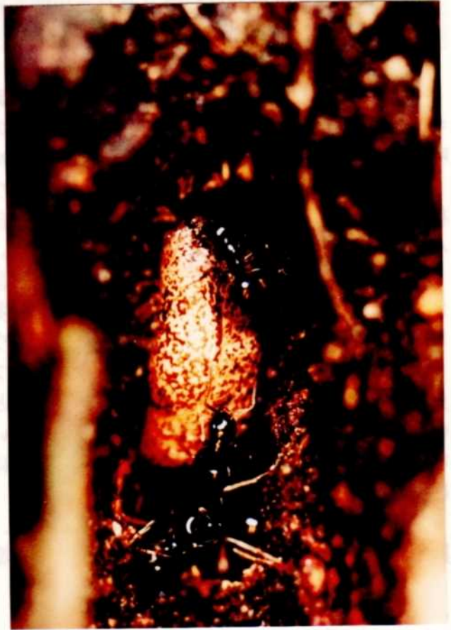
1988年7月31日 白峰村大杉谷にて

以上、ムモンアカの飼育完品を蛹採集により得られるめどがついた。ただし、蛹の時期にミズナラの根元にしゃがみ込んでみると、スズメバチが何故かブンブンとまとわりついてくる。刺されない様、ご注意を！