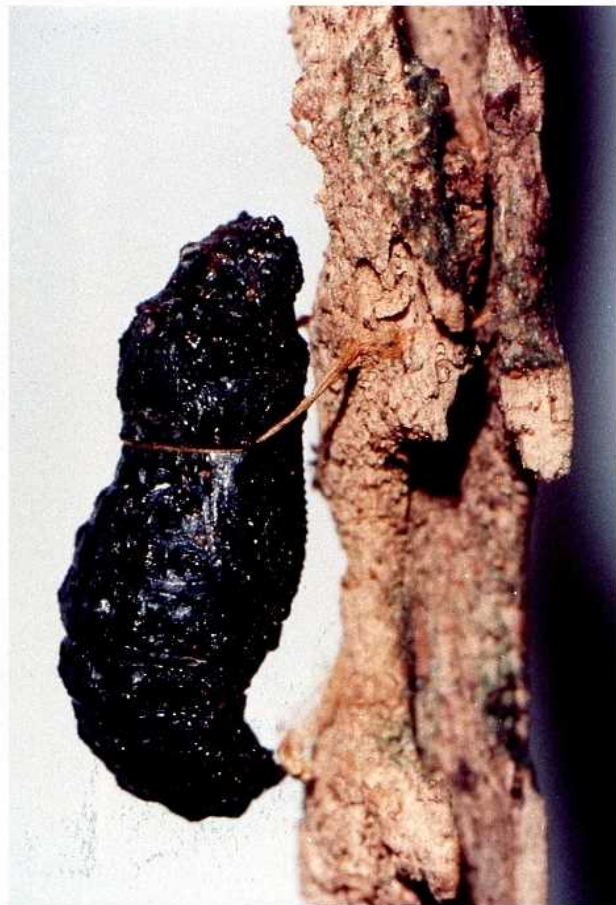
ギフチョウの自然蛹(1986年 3月24日1♂羽化)